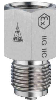
Adapt FS Variante 1

Variante 5: fest eingeschweißt in Manometerkörper